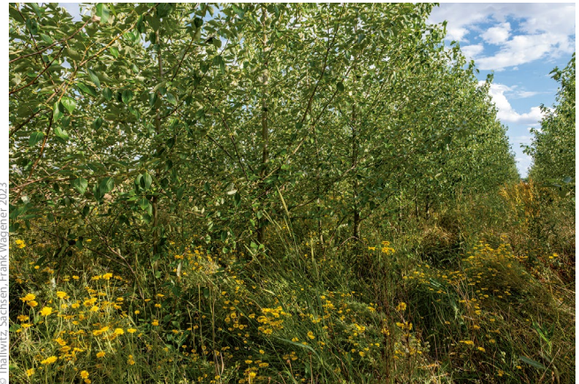
© Thallwitz, Sachsen, Frank Wagener 2023