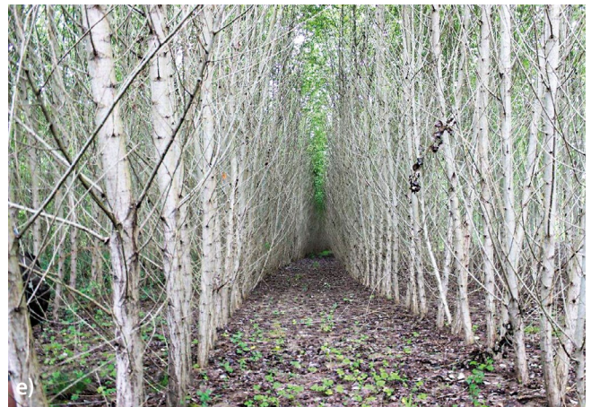
Bild 2: Ein Pufferstreifen mit Energieholz auf einer Retentionsfläche am Odenbach in verschiedenen Entwicklungsstadien (Ingweiler Hof, Rheinland-Pfalz): 2a. kurz nach Kulturbegründung mit viel Licht und teilweise offenem Boden (2017); 2b. Aufwuchs mit andauernder Bodenruhe und randlichen Hochstaudenfluren (2018); 2c. Einwanderung von Schwarz-Erlen in den Pappelverband (2019); 2d. Aufnahme von Hochwasser aus dem Odenbach (2022); 2e. kurz vor der Ernte mit Waldinnenklima und kaum mehr Unterwuchs (2023). Dieser typische Zyklus beginnt nach jeder Ernte von neuem und charakterisiert diesen Lebensraum.

als die einzelnen genannten Elemente. Dies liegt daran, dass sich zum einen die unterschiedlichen Lebensgemeinschaften überlagern, zum anderen gibt es spezifische Grenzlinienbewohner.