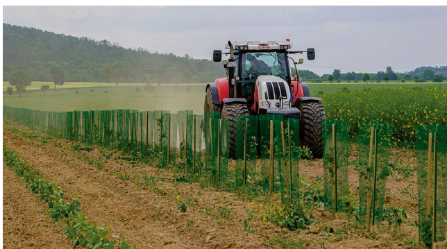
© Böhlitz, Sachsen, Frank Wagener 2025

Werden vergleichbare Ansätze mit struktur- und artenreichen AFS an vielen Standorten bundesweit umgesetzt, so können produktive AFS wichtige Beiträge für die Erfüllung künftiger Verpflichtungen aus der EU-Verordnung über die Wiederherstellung der Natur (WVO) leisten, unter anderem mit Blick auf Artikel 11 WVO zu landwirtschaftlichen Ökosystemen, Indikatoren „Anteil landwirtschaftlicher Flächen mit Landschaftselementen mit großer Vielfalt“ und Feldvogelindex, aber auch Artikel 10 zur Förderung von Bestäuberpopulationen [28].