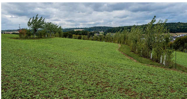
Bild 3: Auf dem Gladbacherhof der Universität Gießen wird als AFS ein biodiverses Keyline-System u.a. im Projekt AFaktive beforscht