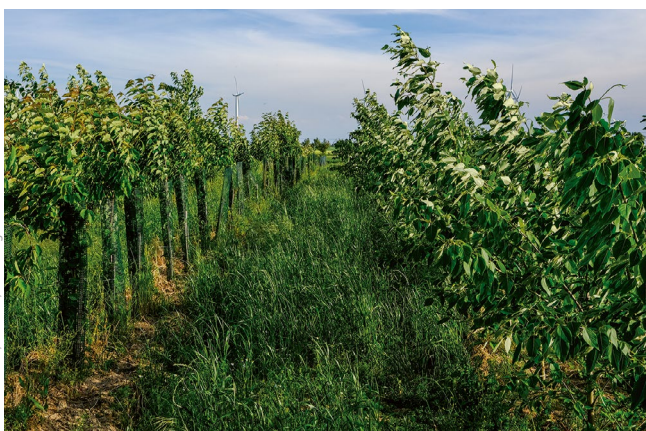
© Lommatzsch, Sachsen, Frank Wagener 2025

Weitergehende ökologische Leistungen lassen sich teilweise ebenfalls mit geringem Aufwand in die Anlage und Bewirtschaftung von AFS integrieren. So können beispielsweise artenreiche Untersaaten und Säume ein einfacher Ansatz zur Verbesserung des Nahrungsangebots und der Lebensraumqualität, aber auch des Wasserrückhalts von AFS sein ( Bild 5 ), siehe hierzu auch den Kasten im Beitrag